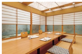
水仙 掘りこたつ 8席