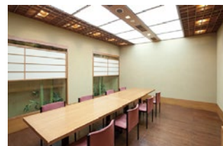
かわせみ テーブル席 8席