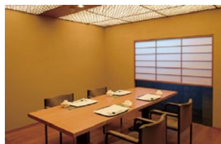
夕顔 テーブル席 4席